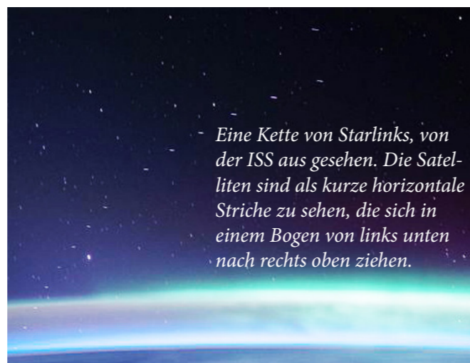
Eine Kette von Starlinks, von der ISS aus gesehen. Die Satelliten sind als kurze horizontale Striche zu sehen, die sich in einem Bogen von links unten nach rechts oben ziehen.

ten fertig gebaut, etwa jeden Monat startet eine Falcon 9 mit einem Paket von 60 Satelliten an Bord. Jeder einzelne wiegt 220-260 kg. Später soll die Startfrequenz verdoppelt werden. Die in Entwicklung befindliche Starship Trägerrakete (siehe unten) kann dann 400 Starlinks auf einmal befördern. Im Juli 2020 waren bereits 480 Satelliten im Orbit.